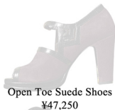
Open Toe Suede Shoes ¥47,250