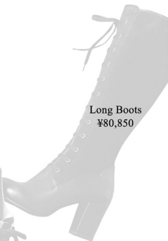
Long Boots ¥80,850