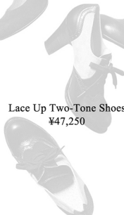
Lace Up Two-Tone Shoes ¥47,250