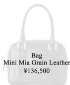
Bag Mini Mia Grain Leather ¥136,500