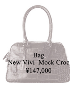
Bag New Vivi Mock Croc ¥147,000