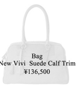
Bag New Vivi Suede Calf Trim ¥136,500