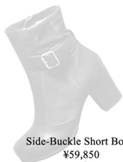
Side-Buckle Short Boots ¥59,850

クラシックなフォルムに施されたカットワークの隙間からのぞく肌は秘かな色気を誘うでしょう。