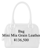
Bag Mini Mia Grain Leather ¥136,500