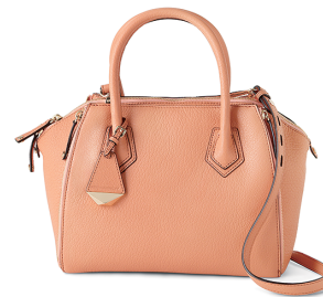
REBECCA MINKOFF ¥55,000

たとえ飛行機に乗らなくても、忙しく駆け回るような日々を送っている現代女性は多いはず。ざくざく荷物が入れられるミニボストンや使い勝手の良いトートバッグはそんな女性たちの必需アイテム。旅でも仕事でも使えるベストパートナーを見つけて。