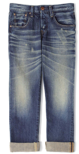
RED CARD ¥19,000