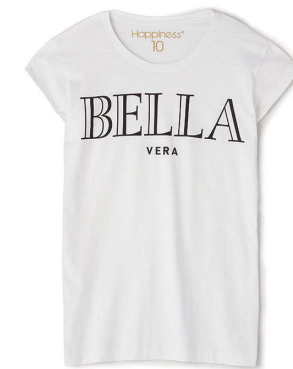
HAPPINESS IS 10 TEE ¥6,000