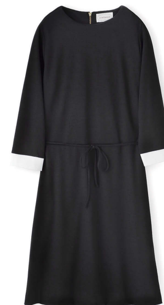
J&M DAVIDSON ¥42,000