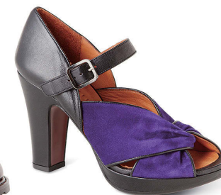
CHIE MIHARA ¥53,000