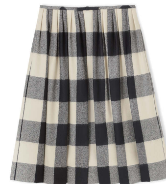
J&M DAVIDSON ¥58,000