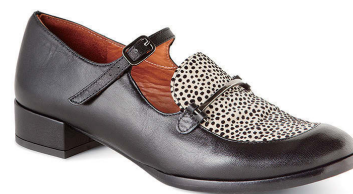
CHIE MIHARA ¥53,000

この秋冬もブーツは注目度の高いアイテム。着用できるコーディネート幅が広いので、やっぱり便利です。 メンズライクなシューズのディテールもまだまだ人気ですが、新たに浮上したのは「モンクストラップ」。 マニッシュになりすぎないよう女性らしさを加えたデザインのものがおすすめです。