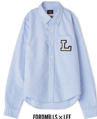
FORDMILLS x LEE ¥18,000