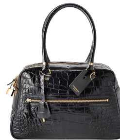
J&M DAVIDSON ¥169,000