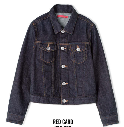
RED CARD ¥25,000