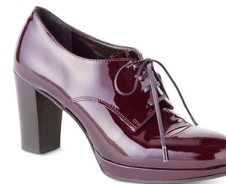
FORDMILLS BY LUCA GROSSI ¥37,000