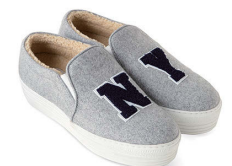
JOSHUA SANDERS ¥39,000