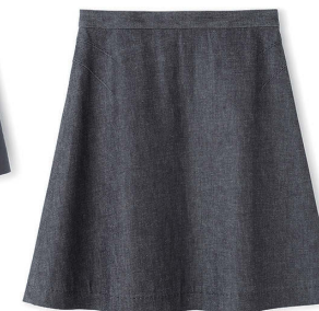
J&M DAVIDSON ¥35,000