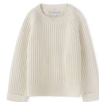
J&M DAVIDSON ¥55,000