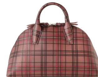
GUM BY GIANNI CHIARINI ¥21,000