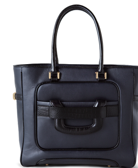
HASHIBAMI MUSE ¥37,000