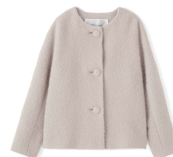
J&M DAVIDSON ¥65,000