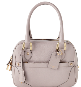
J&M DAVIDSON ¥159,000