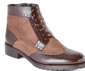
FORDMILLS BY LUCA GROSSI ¥43,000