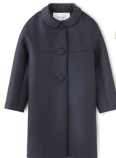
J&M DAVIDSON ¥100,000