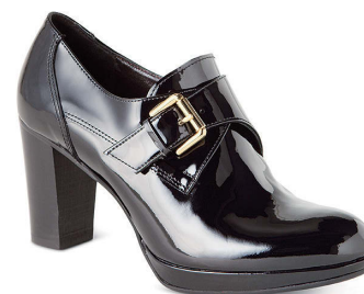
FORDMILLS BY LUCA GROSSI ¥37,000