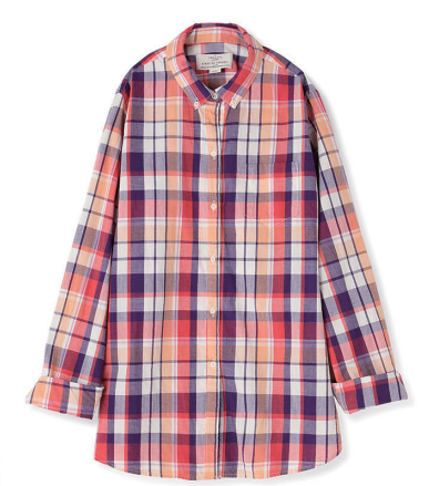
BIRDS OF PARADIS BY TROVATA ¥22,000