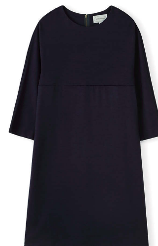
J&M DAVIDSON ¥38,000

ブランドがスタートして30周年を迎える2014A/Wシーズン。“Stepping out/繰り出す”をテーマに、クラシカルなフォルムと技巧を凝らした素材使いでJ&M DAVIDSONらしい洗練されたフェミニティを表現したロマンチックなコレクションを展開します。ANGLOBAL SHOPでもアウターやワンピースを中心にいつも以上にバリエーション豊富なラインナップをご用意しています。