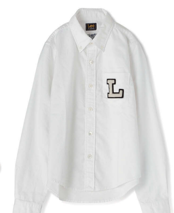
FORDMILLS × LEE ¥18,000