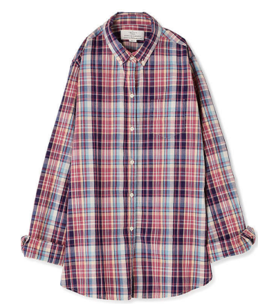
BIRDS OF PARADIS BY TROVATA ¥22,000