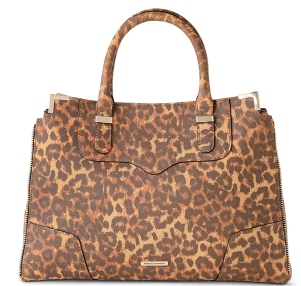
REBECCA MINKOFF ¥46,000