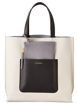
VIA REPUBBLICA ¥36,000